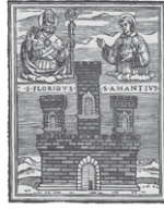
DIOCESI DI CITTÀ DI CASTELLO