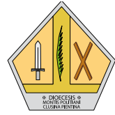
DIOCESI DI MONTEPULCIANO, CHIUSI, PIENZA